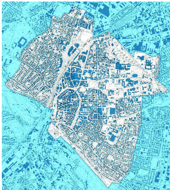
Geltungsbereich des Masterplangebietes (Beschluss SEA vom 04. Sep. 2012)

Im Wesentlichen erstreckt sich der Geltungsbereich im Westen zwischen Nord- und Bürgerpark. Im Süden wird er vom Johannisberg und der Promenade begrenzt. Im Osten bilden u. a. Prießallee und Oststraße die Grenze, während diese im Norden durch die Bahnstrecke Bielefeld-Lengden, die Leibnizstraße und die Sudbrackstraße gebildet wird.